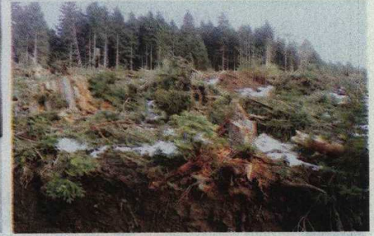
► Vatandaşlar, binlerce ağacın kesildiği Cerattepe ile ilgili yurdun dört bir yanında eylemler yaptı.

Değerlendirme (ÇED) toplantılarını yaptırmasa da şirket 'ÇED Olumlu' kararını aldı. Rize İdare Mahkemesi'nde 2013'te ÇED'in iptali için açılan dava 2 yıl sonra iptal ile neticelendi. Mahkeme, kararını çok temel bir gerekçeyle dayandırdı: "Bu maden faaliyetinin hayata geçirilmesinin, Artvin'in yöre sakinleri açısından yaşam alanı olmaktan çıkacağı, bu bölgede aynı anda dava konusu proje ile bu projenin etkisi altında bulunan yaşam alanları ve koruma altındaki alanların bir arada olmayacağı kanaatine varılmıştır."